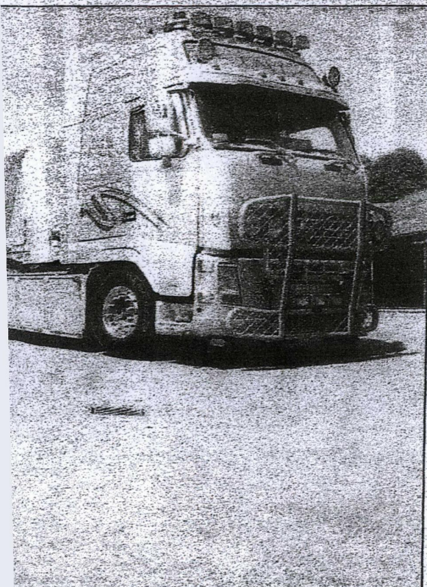
van Lavi Veevoerders.

Over zijn kansen is hij nuchter: „De andere twee wagens in mijn categorie zijn pas een half jaar oud.”